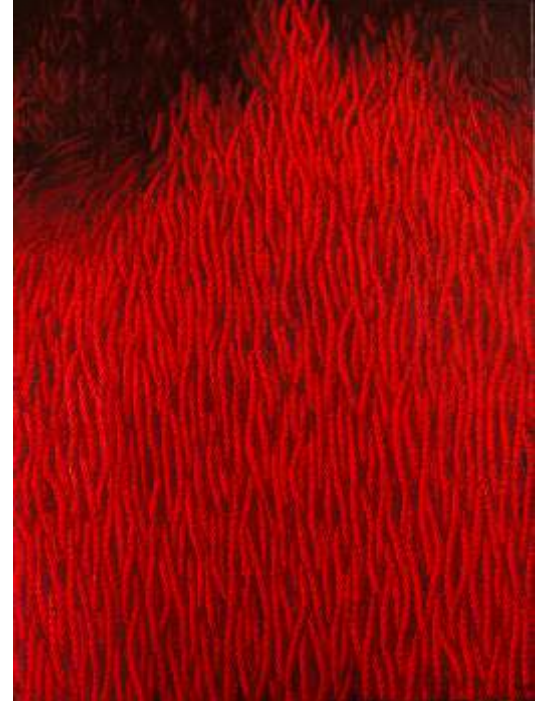
"Tarihsiz Günlükler" 120x90 cm TÜYB - Oil On Canvas 2015

1982 - Turgut Pura Yarışmasında İzmir Resim Heykel Müzesi Ödülü