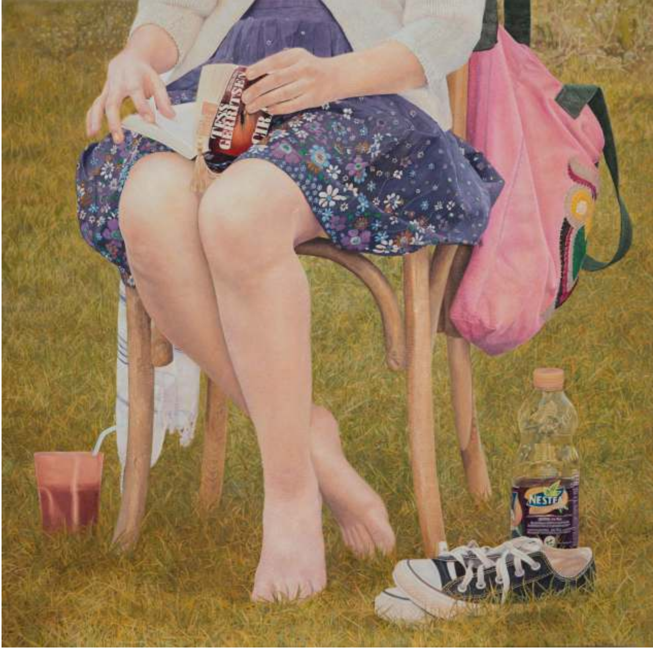
"Meryem UZUNOĞLU" TÜYB - Oil On Canvas 120x120 cm 2016