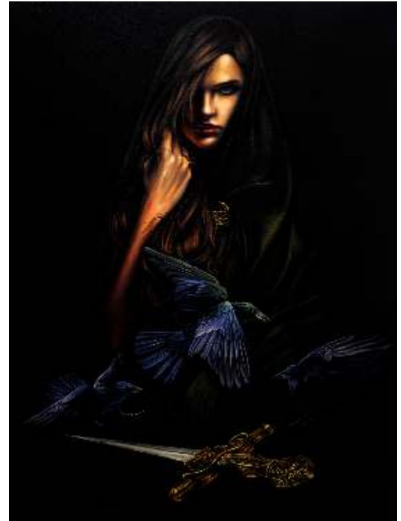
"Psychic-Medium" 120x90 cm TÜYB - Oil On Canvas 2016

2011 - Galeri Soyut Küçük Şeyler Sergisi Ankara