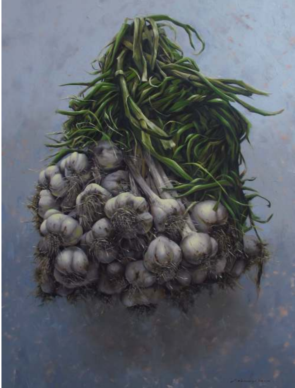
"İsimsiz" 120x90 cm TUYB - Oil On Canvas 2016