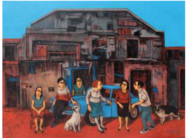
"Orhan Umur" 90x120 cm TUAB - Acrylic On Canvas 2016

2010 - Anadolu Üniversitesi "Yunus Emre" Resim Yarışması "Award of Merit"