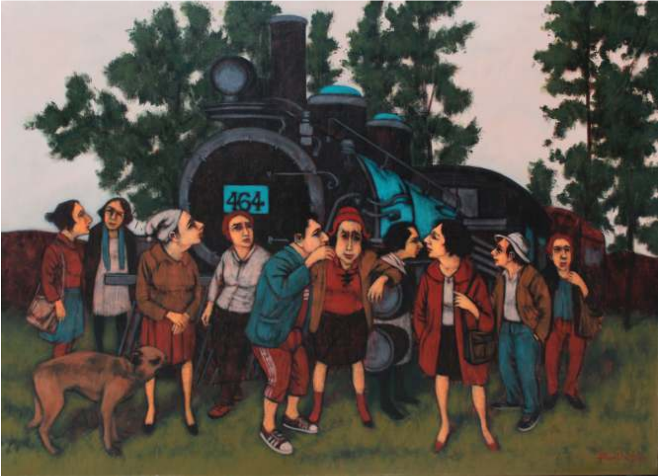
"Orhan Umut" 90x120 cm TUAB - Acrylic On Canvas 2016