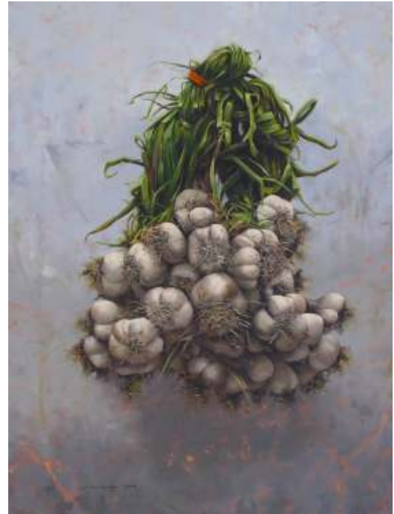
"İsimsiz" 120x90 cm TUYB - Oil On Canvas 2016