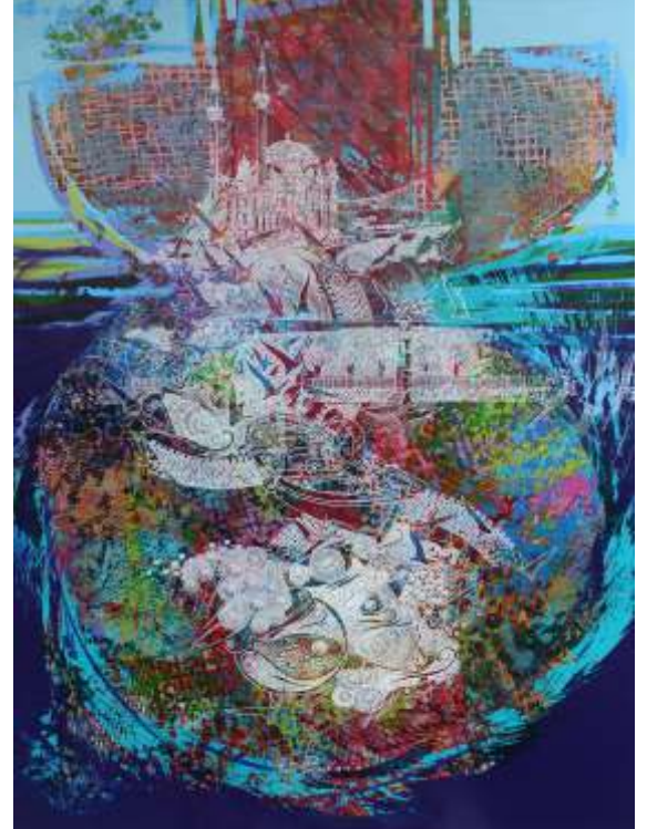
"Engin KORKMAZ" 120X90 cm TÜAB - Acrylic On Canvas 2016

2011 - Mention, in Near Eastern University, School of Fine Arts and Design, "Rauf Denктаş" themed Ex-Libris Competition.