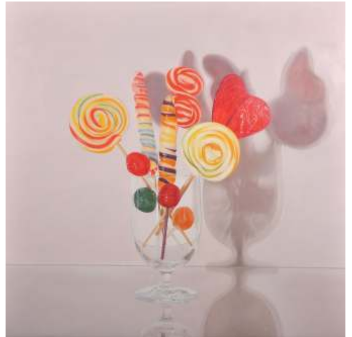
"Son Lolipop" TÜYB - Oil On Canvas 120x120 cm 2014