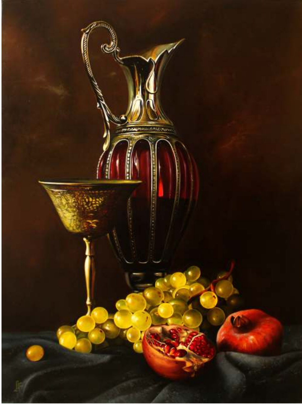
"Hüseyin Feyzullah" 120x90 cm TÜYB - Oil On Canvas 2015