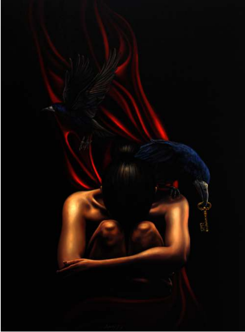
"Hidden Lock - Saklı Kilit" 120x90 cm TYB - Oil On Canvas 2016