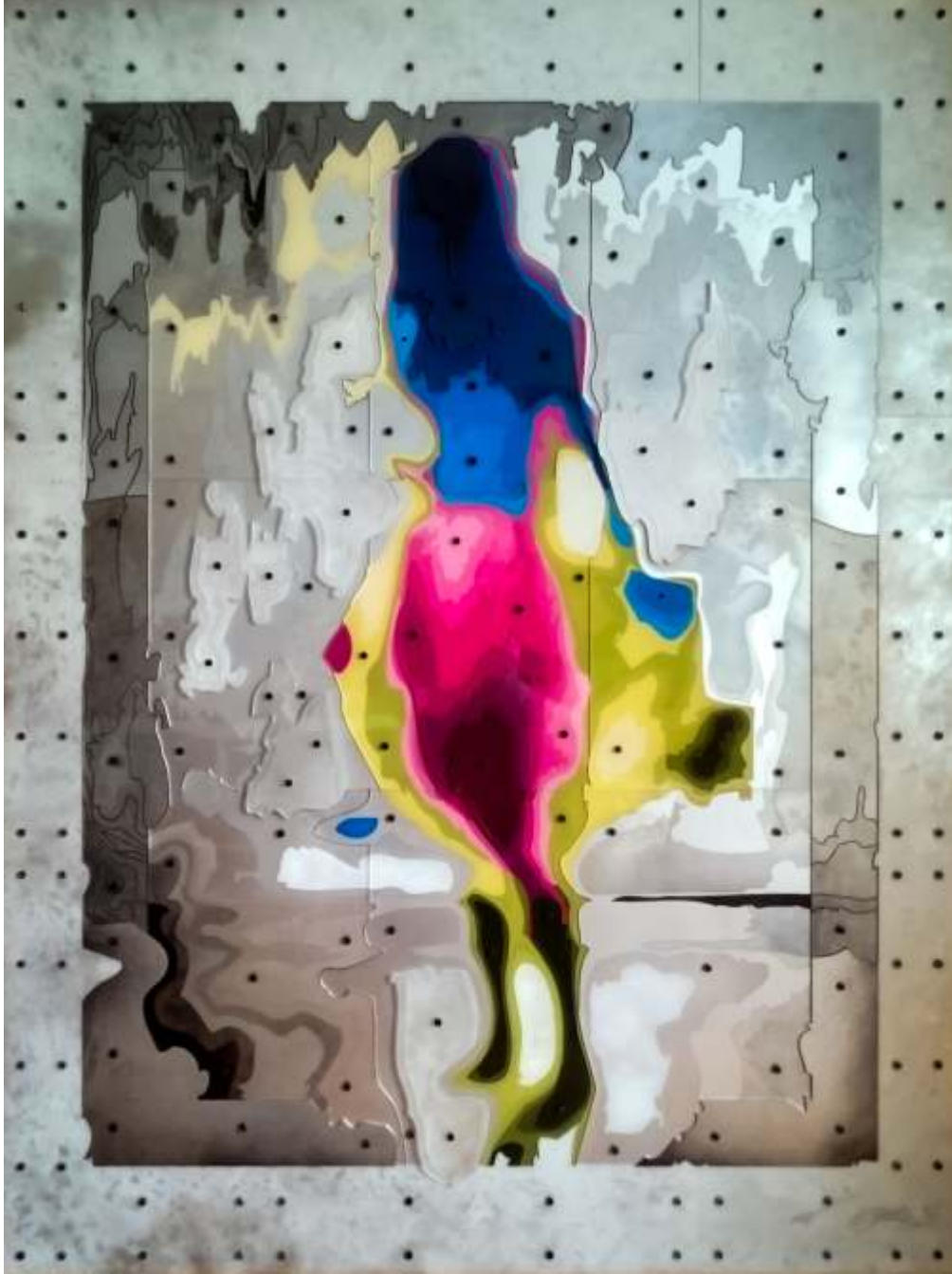
"Su Falı" 120x90 cm plexiglas-ağşap 2016