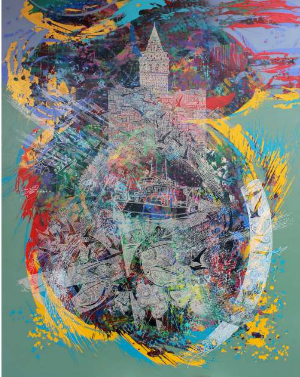
"Engin KORKMAZ" 120X90 cm TAB - Acrilic On Canvas 2016