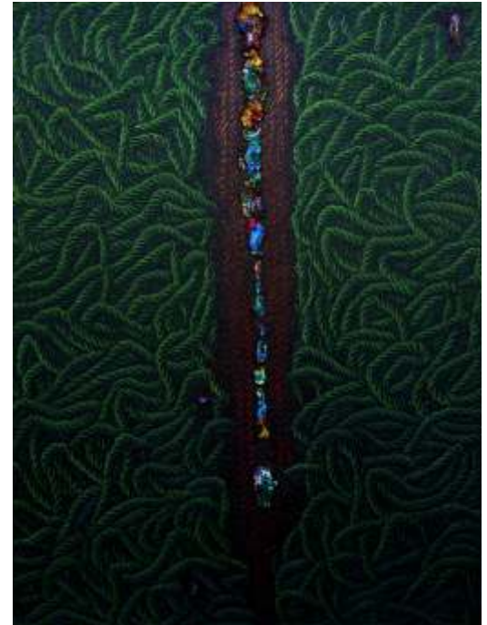
"Tarihsiz Günlükler" 120x90 cm TÜYB - Oil On Canvas 2014

1982 - Turgut Pura Contest, Izmir Painting And Sculpture Museum Award