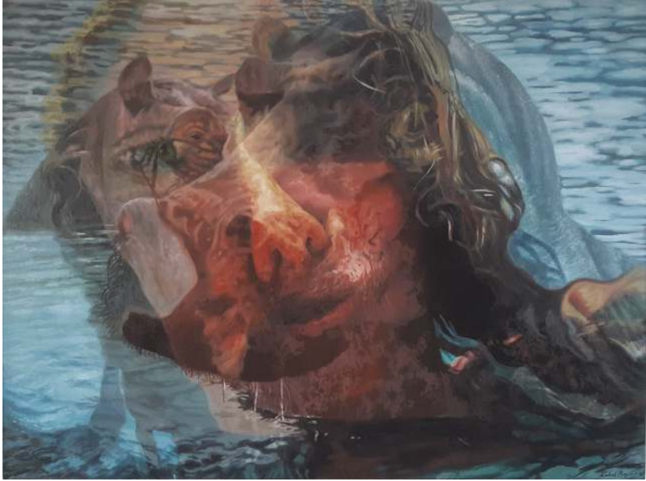
"Su Aygırı Hippopotamus" 90x120 cm TUYB - Oil On Canvas 2016