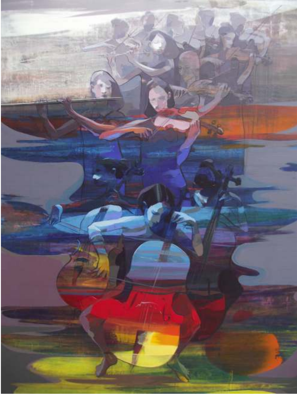
"Hakan ERASLAN" 120x90 cm TÜAB - Acrylic On Canvas 2016