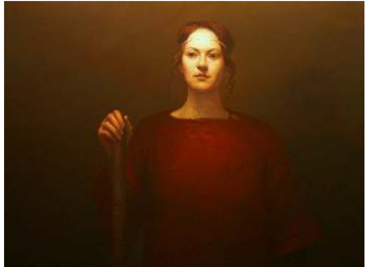
"Sertap YeğİN" 90x120 cm TÜYB - Oil On Canvas 2015