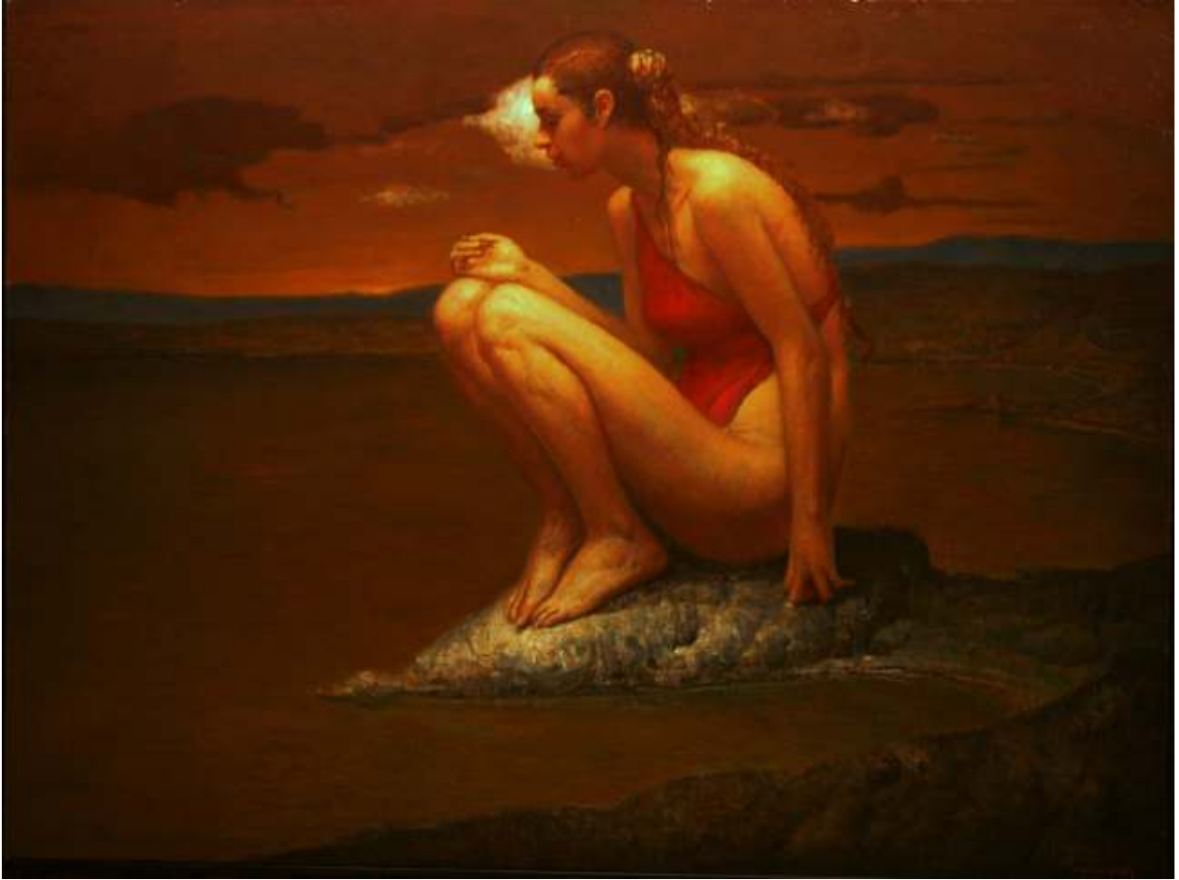
"Sertap Yeğın" 90x120 cm TÚYB - Oil On Canvas 2015