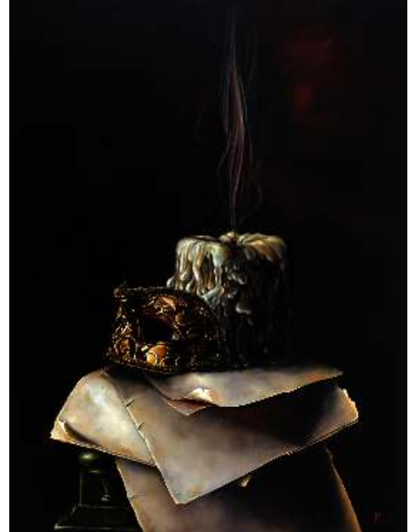
"Hüseyin Feyzullah" 120x90cm TÜYB - Oil On Canvas 2016