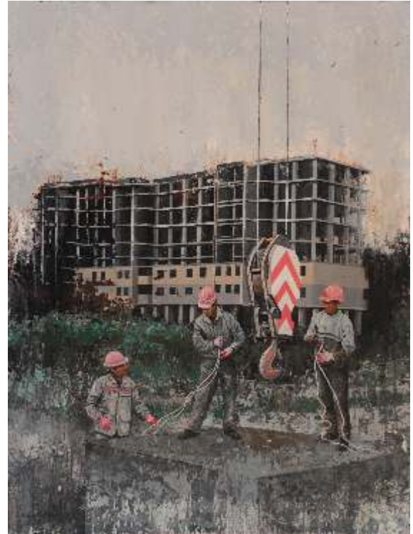
"Şahin Demir" 120X90 cm TUAB - Acrylic On Canvas 2016