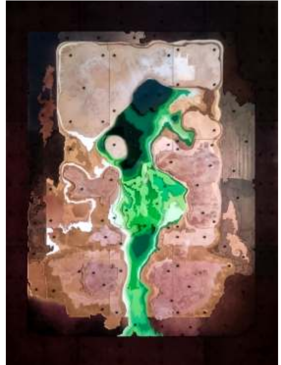
"Kahve Falı" 120x90 cm plexiglas-ahşap 2016

2006 - "GRA 402" Ankara, 2005 "WORDS AND IMAGES" Turkey - British Association Art Gallery - ANKARA