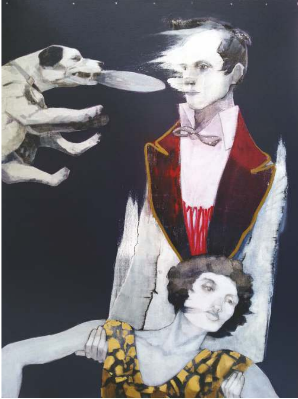
"Sana Anlatmak İstemiřtim" TAK - Acrylic On Canvas 120-90 cm 2016