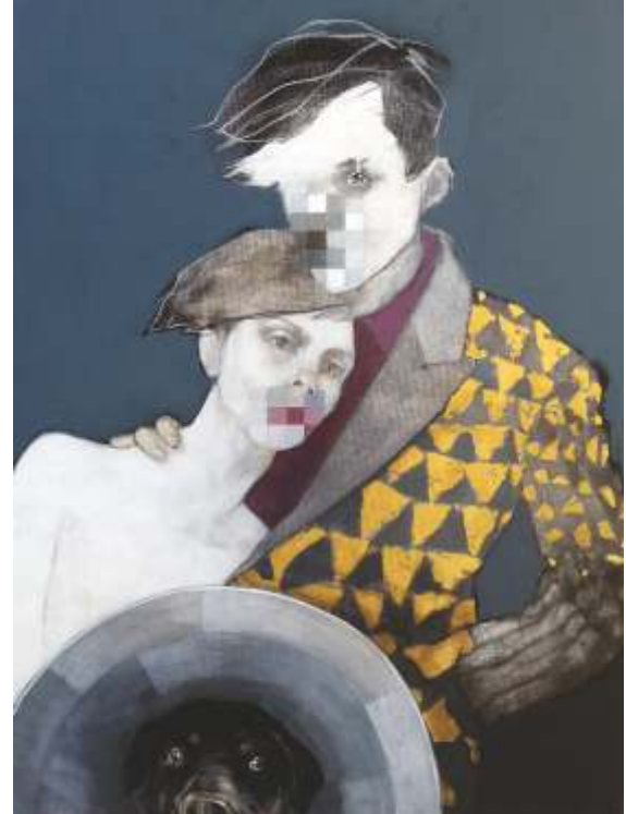
"Sus ve Burnundan Nefes Al" TÜAK - Acrylic On Canvas 120-90 cm 2016

1994 – 1996 – 1998 – 2001 Solo painting exhibitions Trabzon State Fine Arts Gallery. “Başrol figürleri” Solo painting exhibition - Turkuvaz Art Gallery 2007 Ankara. “Başrol Oyuncuları” Solo painting exhibition - Turkuvaz Art Gallery 2007 Ankara. “Başrol figürleri II” Solo painting exhibition - Turkuvaz Art Gallery 2010 Ankara. "Boğulursan eve gelme "- Solo painting exhibition - Turkuvaz Art Gallery 2011 Ankara. “Düşersen Patlarsın” Solo painting exhibition Turkuvaz Art Gallery 2013. ARTİST TÜYAP Galeri Soyut 2013 ,2014,2015 "Mutfak" - Galeri Soyut - A Hall - Solo painting exhibition 2014 Ankara ARTİST 2013 TÜYAP Sanat Fuarı Galeri Soyut 2014 İstanbul SNBA İnternational Arts Activity 2014 Paris - Special Jury Prize PassportART Painting exhibition – Galeri Soyut 2015 "The good for nothing" cermodern hub 2015 SNBA İnternational Arts Activity 2015 Paris