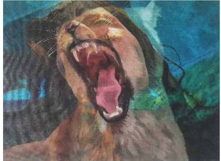
"Dişi Aslan Lioness" 90x120 cm TUYB - Oil On Canvas 2016