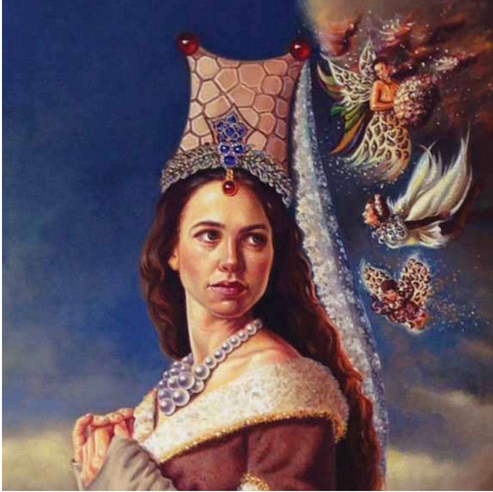
Sağır Sultan Detay / Detail Tuval Üzerine Yağlı Boya / Oil on Canvas , 200x150 cm, 2014