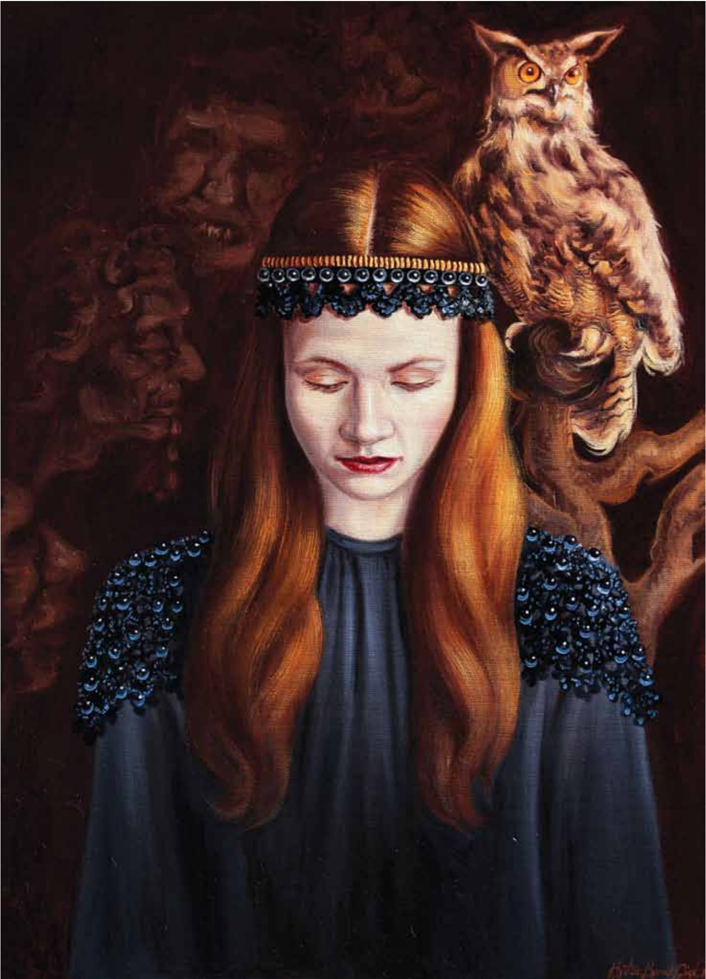
Rüya Tuval Üzerine Yağlı Boya / Oil on Canvas, 70x50 cm, 2015