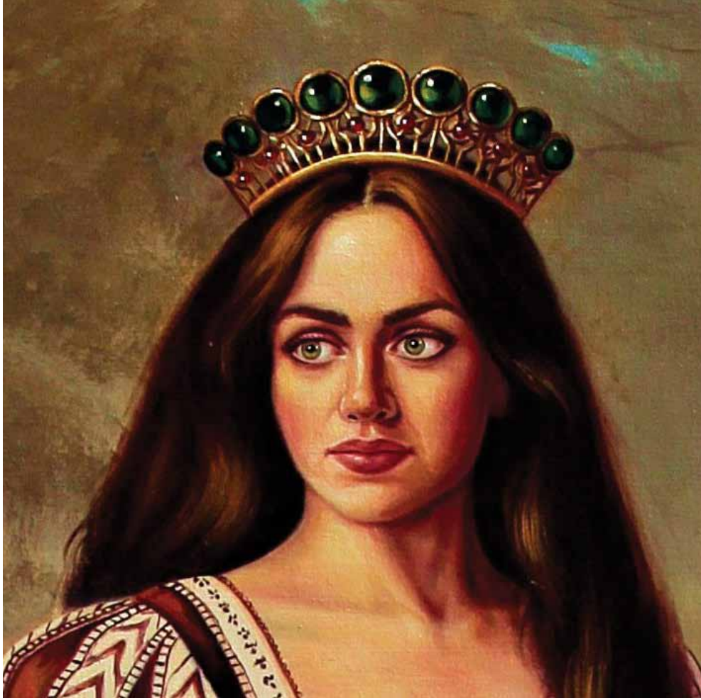
Perili Ormanda Fısıltı