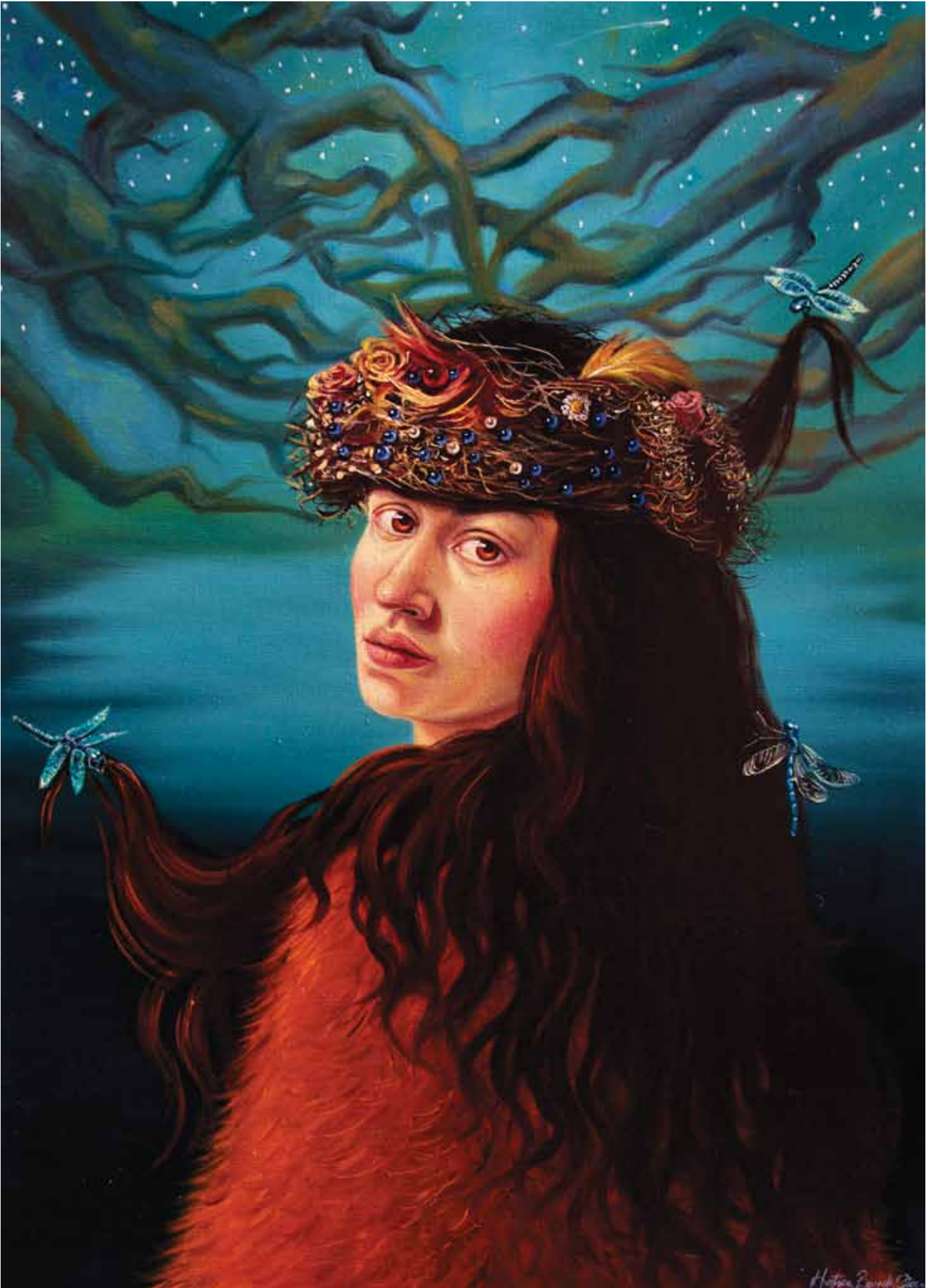
Geçit Tuval Üzerine Yağlı Boya / Oil on Canvas, 70x50 cm, 2015