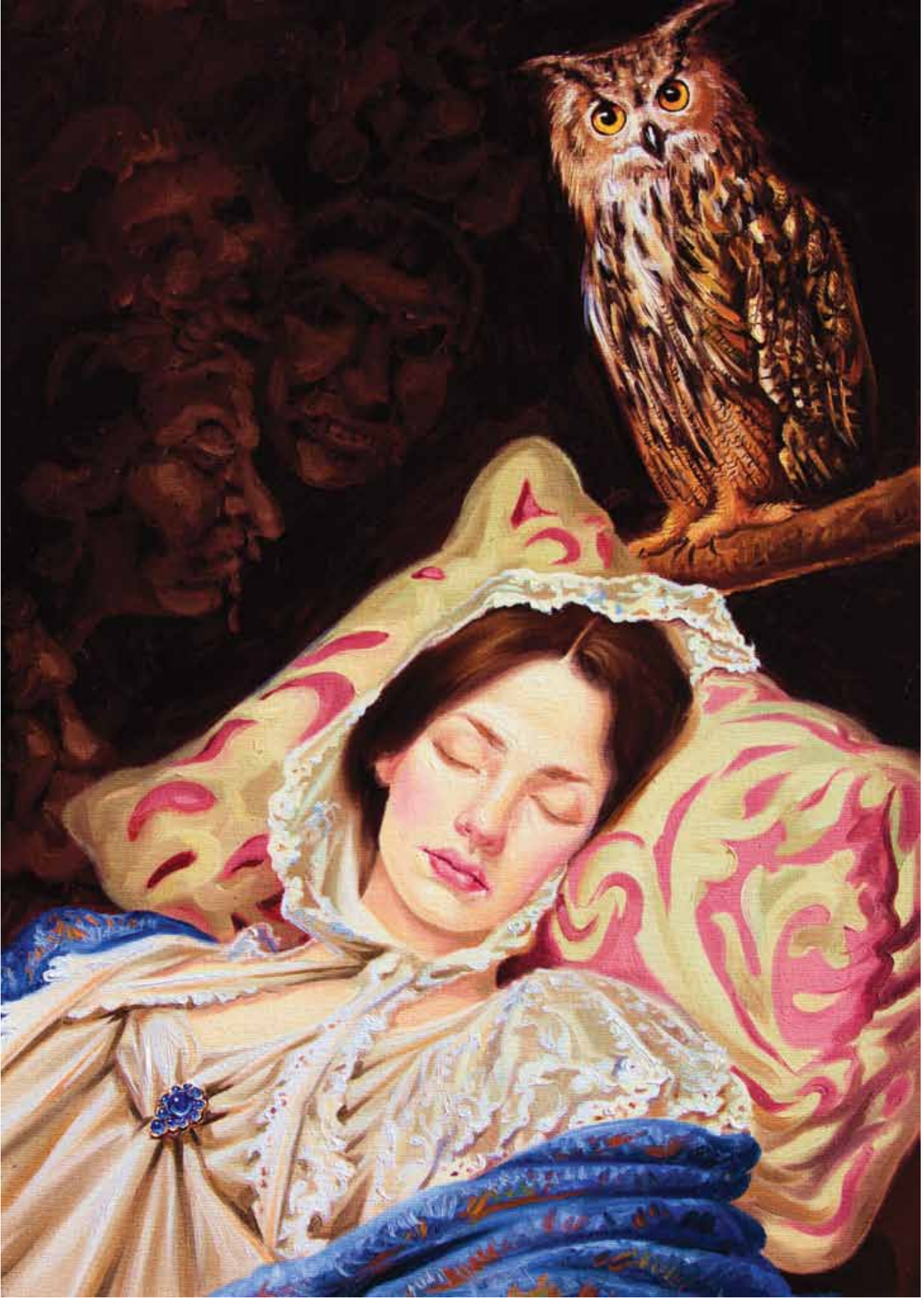
Bekleyiş Tuval Üzerine Yağlı Boya / Oil on Canvas, 70x50 cm, 2015