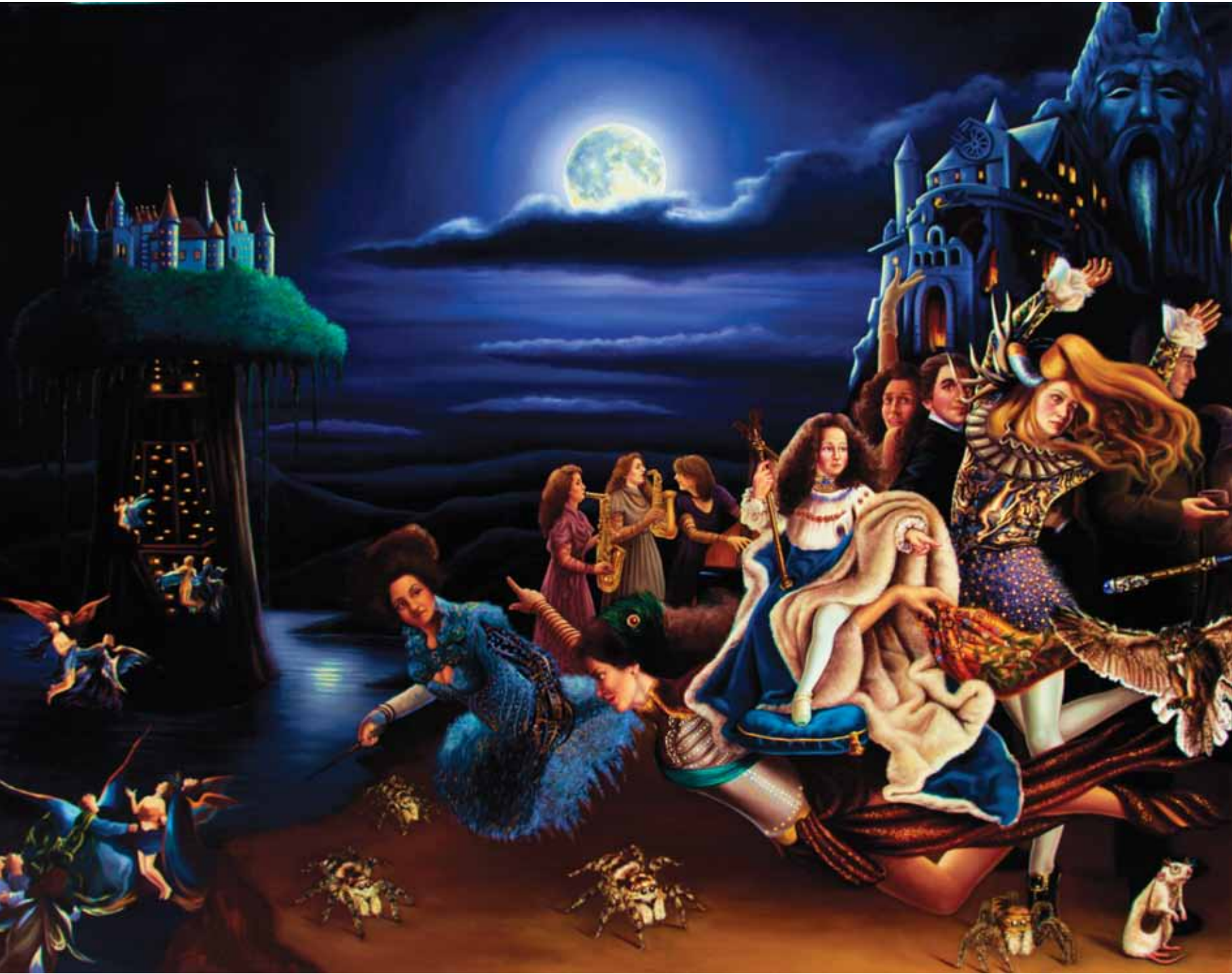
Dolunay Gecesinde Resepsiyon Tuval Üzerine Yağlı Boya / Oil on Canvas, 180x460 cm, 2014