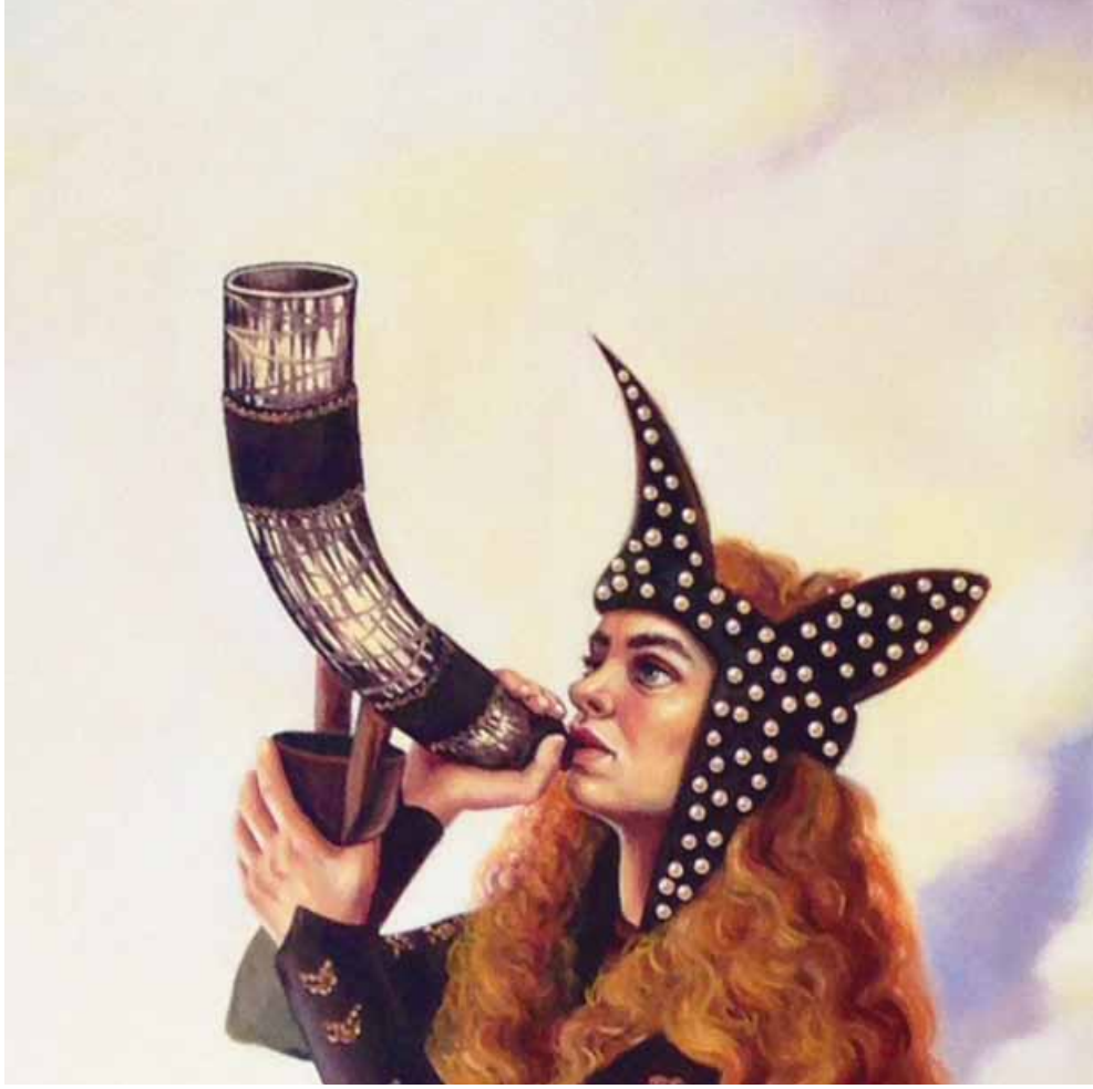
Sesli Saatler Detay / Detail Tuval Üzerine Yağlı Boya / Oil on Canvas , 200x150 cm, 2014